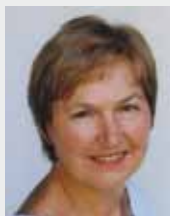
LEITUNG: Gertraud Wohlfart