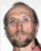
LEITUNG: DI Franz Schrammel Dipl. Feldenkraislehrer