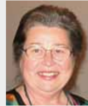
LEITUNG: Elisabeth Macho

TERMINE: jeden Dienstag außer an schulfreien Tagen VERANSTALTUNGSORT: Bildungszentrum St. Bernhard TEILNAHMEBEITRAG: € 10,- pro Monat