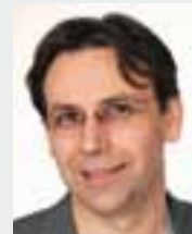
INFORMATION UND REISEORGANISATION: