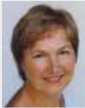
LEITUNG: Gertraud Wohlfart