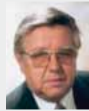
REFERENT UND REISEBEGLEITER

Der Vortrag dient auch zur Einführung zur Studienreise nach Turin und ist für TeilnehmerInnen an der Reise gratis.